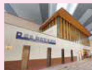
「西山天王山」駅の詳しい情報が満載! http://rail.hankyu.co.jp/tennozsan/

阪急京都線の新駅「西山天王山」駅は2013年12月に誕生しました。東口駅前広場には、京都縦貫自動車道の高速バスストップにつながるエレベーターを設置。宮津・天橋立や横浜、東京ディズニーリゾート®、信州へ的高速バスに乗り継ぎます。阪急電車と高速バスを乗り継いで、いつもより遠くへお出かけしませんか?