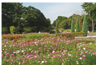
服部緑地 円形花壇