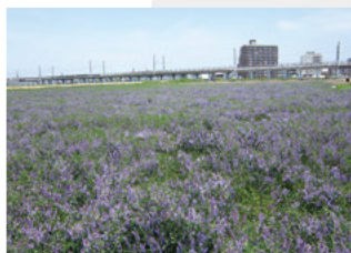
ヘアリーベッチ畑

特典 ・ながさわ明石江井島酒館で地ビールの試飲&締めしおにぎり・明石玉子焼きの屋台販売、お土産コーナーあり ・ゴールで明石地ビールの販売、フードコーナー・明石観光PRコーナーあり