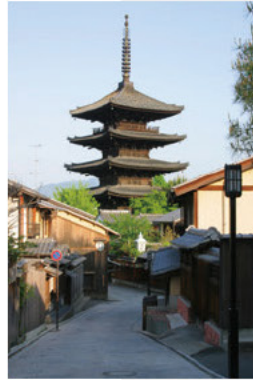
八坂通から見た八坂の塔