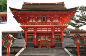
伏見稲荷大社・楼門