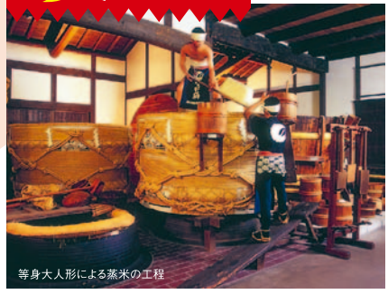
等身大人形による蒸米の工程