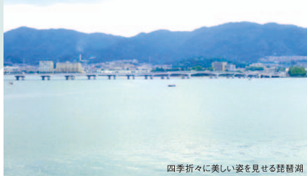
四季折々に美しい姿を見せる琵琶湖