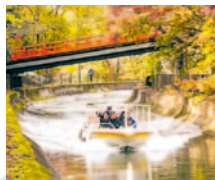
琵琶湖疏水を運航する観光船