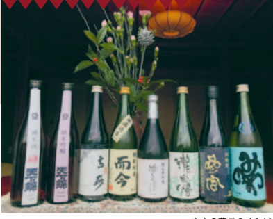
市内の蔵元のイチオシ