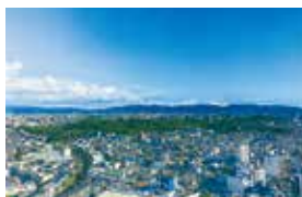
大迫力の眺望が楽しめる

街並みが広がり、遠くは六甲山、あべのハルカス、生駒・金剛山などが見渡せます。くつろげる喫茶コーナーもあります。 9:00～21:00、年中無休。