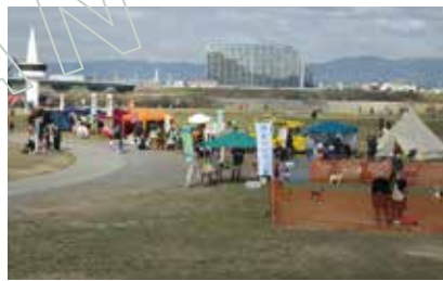
淀川河川公園 みなと五六市会場