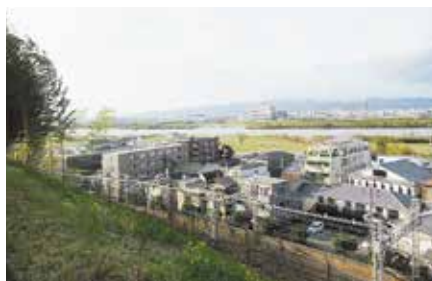
万年寺山からの美しい眺望

枚方八景は1984(昭和59)年10月に、枚方市制35年を記念して「ふるさと枚方」らしい風景を将来に伝承していくことを目的に、市民から候補地を募集して制定されました。今回のコースでは八景に指定されたうち、雄大な自然にあふれた山田池、特別史跡に指定されている百済寺跡、「母なる川」と呼ばれ日本有数の流域面積を持つ淀川、眺望を楽しめる万年寺山の4カ所を訪ねます。四季折々の表情を見せる自然と歴史が融合された枚方市をお楽しみください。