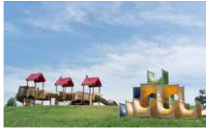
こどもの遊び場もある山田池公園

今回のコースは、阪今池公園を出発し、ひらかたパークを目指す約12キロです。1200年前に築造されたとされる山田池公園で大きな自然にふれあい、淀川では関西最大河川の水辺の風景をご覧ください。コース終盤の京街道枚方宿では東海道57次のうち、56宿目という京街道の歴史情緒も感じていただけます。枚方の雄大な自然と歴史をお楽しみください。