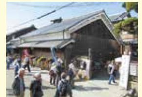
市立枚方宿鍵屋資料館

江戸時代に京都と大阪を結ぶ京街道の宿場町として栄えた枚方。淀川舟運の中継地として商店などがにぎわい、明治以降も蒸気船が行き交っていました。道路や鉄道が整備されると衰退しましたが、現在でも営業を続けている老舗も残っています。その中にある鍵屋資料館は「枚方宿」の歴史を紹介する唯一の展示施設となっています。