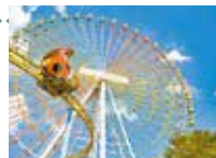
観覧車 「スカイウォーカー」

大規模リニューアルを実施し、現在の姿に。2012(平成24)年には100周年を迎え、新世紀のスタートを切りました。最近では冬季のイルミネーションイベント「光の遊園地」が好評です。