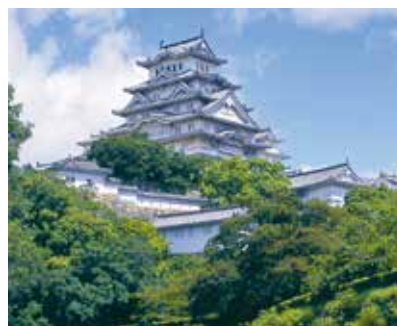
*姫路城大天守保存修理期間中のため、2015年3月26日(木)まで大天守内部の見学は不可。

NHKの大河ドラマ「軍師官兵衛」の舞台として話題の姫路。姫路城主・黒田職隆(もとたか)の嫡男として生まれた官兵衛は、青年時代を姫路で過ごし、軍師として豊臣秀吉の天下統一を支えました。そんな姫路には、「ひめじの黒田官兵衛大河ドラマ館」や「官兵衛の歴史館」など、今だけ楽しめる旬なスポットも登場。姫路城周辺を散策しながら、官兵衛の世界観をたっぷり体感しませんか。