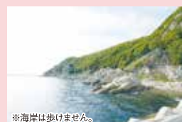
*海岸は歩けません。

瀬戸内海に沈む美しい夕日を眺められる小赤壁公園。名称の由来は、江戸時代後期に活躍した漢学者・頼山陽(らい・さんよう)が、中国・長江(揚子江)中流にある赤壁をイメージして名づけたといわれます。三国志に登場する孫権・劉備軍と曹操軍の戦いの舞台として知られる赤壁。劉備が見たであろう景色に思いを馳せながら、小赤壁を眺めると、違った景色が広がるかもしれません。