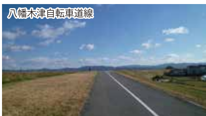
八幡木津自転車道線