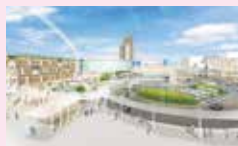
枚方市楠葉花園町15-1 http://www.kuzuha-mall.com

京阪樟葉駅前の「KUZUHA MALL」が2014年3月12日、大阪府下最大級のショッピングモールに進化。日本初、関西初など、施設には約230店ものショップが登場。旧3000系レピカーを保存した京阪ミュージアムゾーンも誕生し、運転体験も楽しめます。