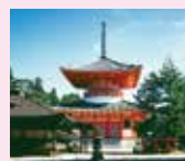
南海高野はつと・ねっと http://www.nankaikoya.jp/

山地の霊場と参詣道」として世界遺産に登録され、来年には開創1200年を迎えます。天空の一大宗教都市「高野山」へ神秘と癒しを感じに出かけませんか。