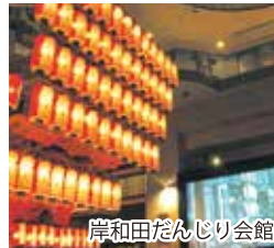
岸和田だんじり会館