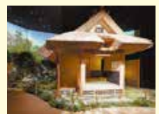
玄庵を再現した茶室「中之島玄庵」

中之島フェスティバルタワー・ウエスト4階にある中之島香雪美術館では、常設展示として国指定重要文化財・旧村山家住宅(神戸市)に立つ茶室「玄庵」が原寸大で再現されています。かやぶき屋根、土壁、柱なども本物と同じ材質を使っているのが特徴。※イベント当日