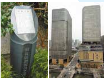
朝日新聞大阪本社が入る「中之島フェスティバルタワー」(写真右)、新聞創刊の地に立つ記念碑(大阪市西区江戸堀1丁目)

今年、創刊から140周年を迎えた朝日新聞は、1879(明治12)年1月25日に大阪・江戸堀(現在の大阪本社の所在地から約500m南)で記念すべき第1号を発行しました。当時は4分で1カ月の購読料が18銭。1904(明治37)年1月5日には名物コラム「天声人語」欄が誕生。15(大正4)年から主催している全国高等学校野球選手権大会(全国中等学校優勝野球大会としてスタート)が昨年第100回を迎え、今年は「第101回」の新たな歴史を刻みます。