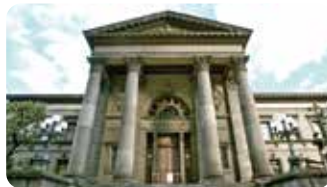
中之島に建つ歴史的建造物 左:大阪府立中之島図書館 下:大阪市中央公会堂