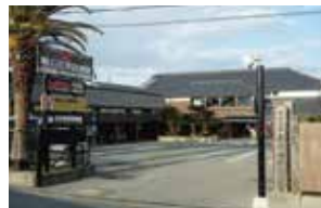
ながさわ明石江井島酒館