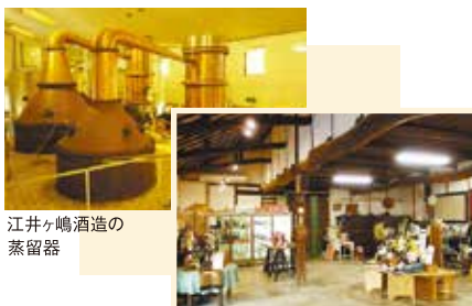
江井ヶ嶋酒造の 蒸留器