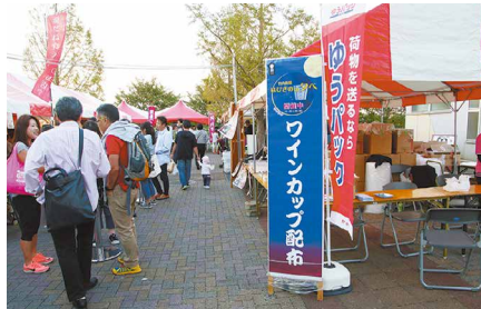
イベントで日本酒やワインを堪能しよう

2017年に日本最古の官道として日本遺産に認定された「竹内街道・横大路(大道)」の沿線市町村のお酒やグルメ、特産品などが集まるイベント“はびきののタベ”。一夜限りの日本酒&梅酒飲みくらべや、羽曳野の誇るワイナリーが集うワインフェスを開催し、地域特産品満載の軽トラ市や屋外映画祭、ダンスやお笑いライブなども楽しめます。