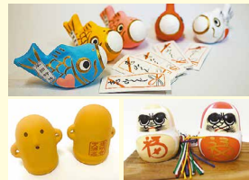
(上) 恋みくじ (左下) はにわみくじ (右下) ダルマみくじ

コースで巡る各社寺の個性的なおみくじにも注目。学問の神である菅原道真公を祭る道明寺天満宮の“はにわみくじ”、西国三十三所の第5番札所である葛井寺(ふじいでら)の“ダルマみくじ”、緑に囲まれた参道が「大阪みどりの百選」に選ばれている辛國(からくに)神社の鯉(こい)の形がかわいい“恋みくじ”など種類も豊富です。