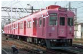
めでたいでんしゃ さち