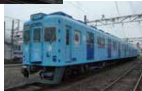
めでたいでんしゃ かい