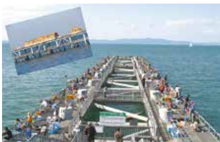
とっとパーク小島

関西国際空港二期事業の埋め立てで土砂の積み出しに使用した栈橋を活用した、人気の海釣り公園です。雨の日でも傘が必要ない釣りスペースや救命具の無料貸し出しもあり、女性や子どもも安心して楽しめます。展望デッキ(無料エリア)からの眺めも魅力で、岸側の円形ドーム「とっと食堂」では、地元産のタコを使った「タコ飯」「タコカレー」のほか、週末限定メニューの海鮮丼などが味わえます。