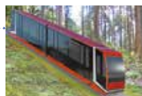
【新型 高野山ケーブルカー】(イメージ)

の根本大塔を想起させる“朱色”をコンセプトカラーに採用しました。和洋折衷のデザインは高野山への「期待感」を醸成。極楽橋駅と高野山駅を結ぶ標高差約330mを快適に駆け上がります。