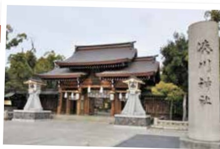
多くの参拝客が訪れる湊川神社

後醍醐天皇に忠義を誓い鎌倉幕府倒幕のために戦った武将・楠木正成公を祀る「湊川神社」。湊川の戦い(1336年)で正成公が自刃された「殉節地」や、徳川光圀公が江戸時代に建て、後に吉田松陰や坂本龍馬ら幕末の志士がこぞ参拝した正成公の墓碑があります。拝殿の天井には、福田眉仙「大青龍」や棟方志功「運命」などの奉納画が掲げられ、殿内で参拝できる正月三が日にはじっくりと鑑賞できます。紅葉のスポットとしても人気。美しく染まった木々を見ようと、11月には多くの参拝客でにぎわいます。