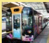
連携記念のラッピング列車

阪神電車は昨年、台湾にある桃園(とうえん)メトロとの連携協定を締結し、現在さまざまなコラボ企画に取り組んでいます。その一環として「阪神電車×桃園メトロ連携記念ラッピング列車」が運行中。列車にはメトロ沿線の文化などが描かれ、熱気球イベントの開催地である桃園市をイメージし、つり革には気球のデザインが施されています。