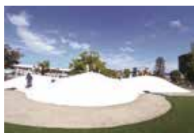
陽だまり広場にあるふわふわドーム