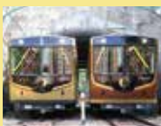
石清水八幡宮参道ケーブル

令和元年に、八幡市から男山山上間をつなぐ「男山ケーブル」が「石清水八幡宮参道ケーブル」へと名称が変わりました。神の使いとされる石清水八幡宮の「阿吽の鳩」になぞらえた車両デザインに。同八幡宮の社殿や京阪特急伝統のツートンカラーをモチーフにし、「あかね」「こがね」と新たな愛称が付けられました。