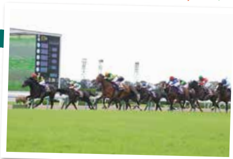
イベントなどで家族連れにも人気

ファミリーで楽しめる西日本最大級のトランポリン遊具「ふわふわドーム」のほか、大型遊具も充実。ポニー試乗会や馬車試乗会など馬と触れ合うイベントも開催しています。