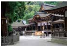
大神神社(三輪明神)