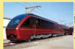
新型名阪特急「ひのとり」

近鉄は、「くつろぎのアップグレード」をコンセプトにした新型名阪特急「ひのとり」を3月14日(土)から運行します。快適性のある空間を追求し、日本で初めて全席に座席後部を覆う「バックシェル」を導入するほか、全車に空気清浄機を設置するなど車内の居住性を従来よりも大幅に向上させています。