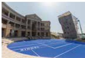
カンカンベイサイドモール

※共催:「なすびんウォーク2020」(一般社団法人KIX泉州ツーリズムビューロー)