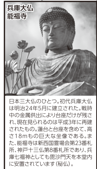
兵庫大仏 能福寺 日本三大仏のひとつ、初代兵庫大仏は明治24年5月に建立された。戦時中の金属供出により台座だけが残り、現在見られるのは平成3年に再建されたもの。蓮台と台座を含めて、高さ18mもの巨大な坐像である。また、能福寺は新西国霊場会第23番札所、神戸十三仏第8番札所であり、兵庫七福神としても毘沙門天を本堂内に安置されています(秘仏)。