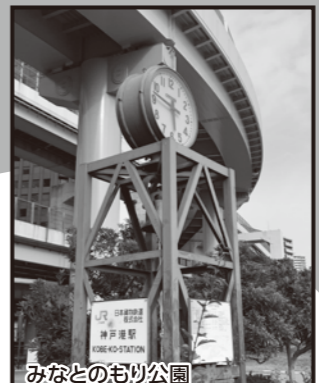
みなとのもり公園 神戸震災復興記念公園として整備された「みなとのもり公園」は、かつて「JR貨物 神戸港駅」があった場所で、神戸港駅にゆかりのあるものが設置されています。構内で時を刻んできた大時計も設置され、復興の始まりを祈念して震災発生時刻である5時46分を刻んでいます。