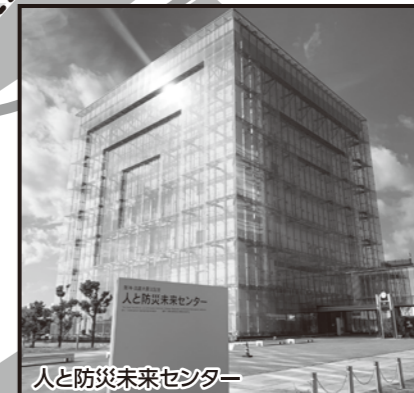
人と防災未来センター

1995年1月17日に発生した地震により6,400人を超える人命が失われ、甚大な被害をもたらした阪神・淡路大震災。その経験と教訓を継承し、防災・減災の実現のために必要な情報を発信する施設です。展示資料や当時の映像、震災体験者の話などをもとに、一人ひとりが災害に対する正しい知識を身につけることができます。また、2021年にリニューアルした東館は、幅広い世代の皆さんに楽しみながら最新の防災知識を学び、自然災害に備える力を養っていただくことができます。(見学所要時間、西館と東館あわせて2時間)