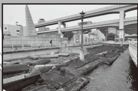
神戸港震災メモリアルパーク 「神戸港震災メモリアルパーク」では、阪神・淡路大震災で被災したメリケン波止場の岸壁を約60メートル、震災遺構としてそのまま保存しています。傍らには、神戸港の災害状況や復旧の過程を伝える模型や映像、写真なども展示。震災の壮絶さと、復興への努力が感じられます。