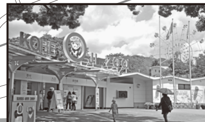
王子動物園 六甲山麓に広がる自然豊かな動物園。キリン、コアラ、アジアゾウなど、約120種700点の動物たちと出会えます。動物に身近に親しめる「ふれあい広場」、楽しく学べる「動物科学資料館」などもあり、子供から大人まで1日楽しく過ごせます。

1995年1月17日に発生した地震により6,400人を超える人命が失われ、甚大な被害をもたらした阪神・淡路大震災。その経験と教訓を継承し、防災・減災の実現のために必要な情報を発信する施設です。展示資料や当時の映像、震災体験者の話などをもとに、一人ひとりが災害に対する正しい知識を身につけることができます。また、2021年にリニューアルした東館は、幅広い世代の皆さんに楽しみながら最新の防災知識を学び、自然災害に備える力を養っていただくことができます。(見学所要時間、西館と東館あわせて2時間)